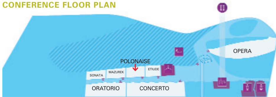
I Piętro / Second Floor